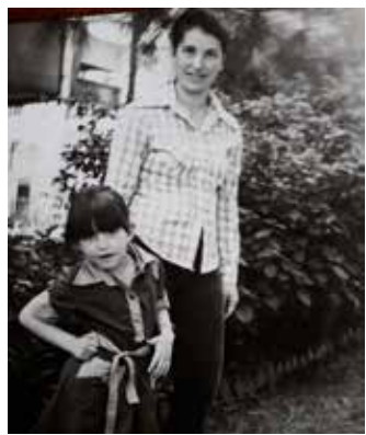
Alpak ve annesi Uzunhafız sokakta (1978)

◆ Yeldeğirmeni ile ilgili kitabınızın yine burada konuşulmuş bir yayınevinden çıkması da güzel olmuş. Nasıl gelişti bu süreç? Notabene ile tanışmam ilginç aslında. Bir arkadaşımın, mahalleye kitabevi açılmış demesiyle başlıyor hikaye. Mahalle kültüründe yeni bir yer açıldığında hayırlı olsun diye alışveriş yapmak vardır. Gidip kitap aldım, çay içtim, sıcak insanlar... Tanışmamız böyle oldu. Çıkarırken 'benim de bir öykü kitabım var' dedim, yollayın dediler. Bir ay sonra aradılar ve başladık.