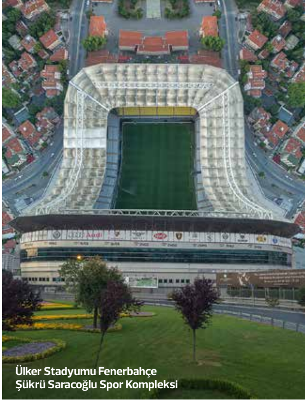
Ülker Stadyumu Fenerbahçe Şükrü Saracoğlu Spor Kompleksi