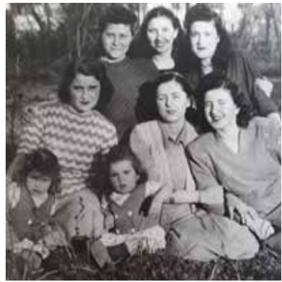
Duatepe sokak, Yeldeğirmeni kadınları (1950)