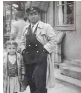
Recaizade sokak, Alpak'ın dedesi ve teyzesi (1945)