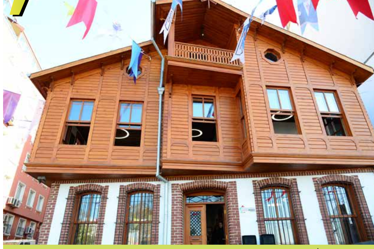
Eğer siz de Rasimpaşa'daki Sosyal Hizmet Merkezinden yararlanmak isterseniz, Rasimpaşa Mah. İskele Sk. No:2 adresine giderek kayıt yaptırabilirsiniz. Detaylı bilgi için de 0530 153 16 15 numarasını arayabilirsiniz.

de hak temelli eğitim faaliyetleri, psikolojik ve hukuki danışmanlık gibi kadını her alanda destekleyen hizmetler veriliyor. Merkezi konumda olması nedeniyle kadınların kolayca ulaşabilecekleri "Kadın Dayanışma" birimi hem bölge geneline, hem de İstanbul ölçeğinde hizmet veriyor." şeklinde konuştu.